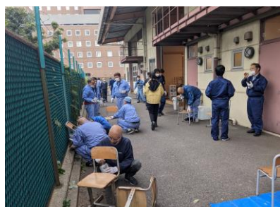
机・イスの補修（全体）