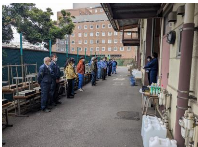
作業前（安全作業の説明）