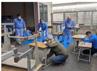
机・イスの補修（錆落とし・塗装）