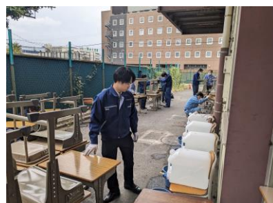
机の傷・汚れの確認